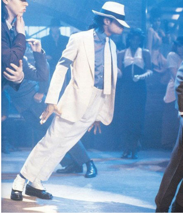
MJ với bước moonwalk độc đáo

Tháng Giêng 1985, buổi thu nhạc phẩm We Are The World được thực hiện tại Hollywood, sau chương trình American Music Awards. MJ không tham dự lễ American Music Awards để có thời gian thu trước We Are The World để làm mẫu cho các ca sĩ khác sẽ đến sau. Sau lễ phát thưởng American Music Awards thì các ca sĩ đến. Chương trình thu âm cũng gặp nhiều khó khăn vì các ca sĩ than phiền nhiều đoạn của nhạc phẩm có âm độ quá cao so với giọng hát của họ, Quincy Jones phải lần nữa thay đổi các cặp và các đoạn nhạc để thích hợp với giọng hát của từng người.